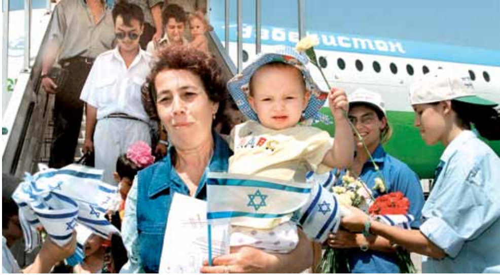
משרד הקליטה פועל כמעט אך ורק למענם. עולים מברית המועצות

שיבינו את מושג הדיאלוג, הדיאלקטיקה, ההתמודדות עם דעות שונות, שיתרגלו חשיבה ביקורתית. שיבינו שלא כל מה שהמורה אומר – והמורים בדרך כלל אומרים אותו דבר – הוא תורה מסיני."