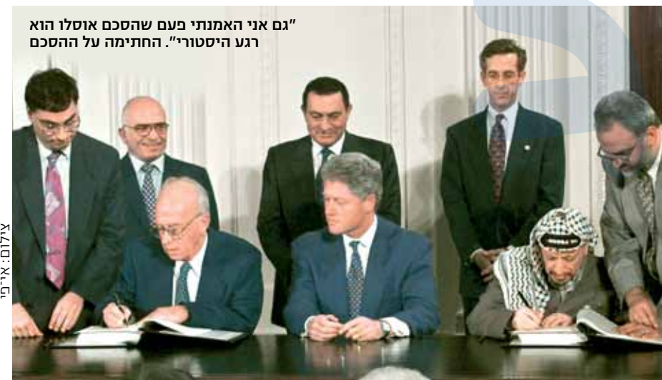
"גם אני האמנתי פעם שהסכם אוסלו הוא רגע היסטורי". החתימה על ההסכם

"נכנסתי לאוניברסיטה, לקודש של השמאל הישראלי שהיה שרוי בחגיגה של פירוק המדינה וחיסול הציונות, וחיללתי אותו בתמימות הציונית שלי. במחלקה למדע המדינה לא היה מרצה אחד שלא תמך בתהליך אוסלו. הייתי צריך לעלות לארץ כדי להיתקל לראשונה ביהודים משעממים. בחו"ל תמיד היהודים נחשבו חריפי מוח ומתוכחים, ופה כולם הולכים בתלם, אומרים אותן שטויות"