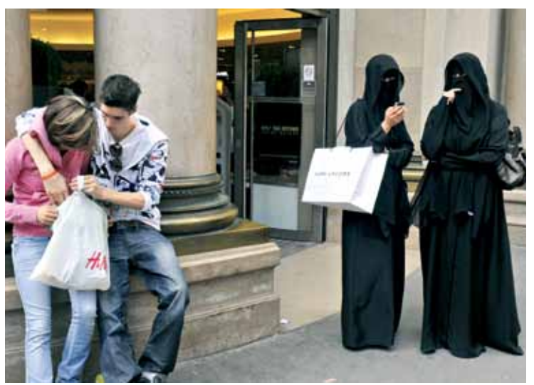
"ליהודים אין מה לחפש בצרפת, אבל בארץ מזהירים אותם מהקליטה כאן". רחוב פריזאי

הידע הנוסף שרכש על תולדות ישראל ושכנותיה בלימודיו המתקדמים, ולבסוף מלחמת ראש השנה תשס"א, הורידו לו את האסימון סופית כלשונו. "המונוליתיות באקדמיה בישראל מסוכנת לדמוקרטיה. היה מועיל מאוד לחוגים למדע המדינה באוניברסיטאות בארץ לו הונהגה בהם בשנה א' חובת לימוד גמרא או דיאלוגים אפלטוניים.