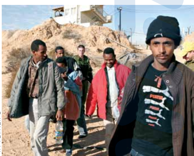
להחזיר אותם לשם וללמדם להתפתח. מסתננים סודנים