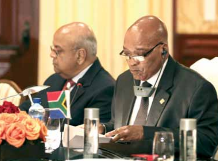
”באפריקה יש לנו הכי הרבה אוהדים”. נציג אפריקני במליאת האו”ם