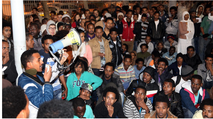
הפגנת נגד ניוש המסתננים בדרום תל אביב.

כמו מדינות אחרות החתומות על 'אמנת הפליטים' של האו"ם (1951), ישראל מחויבת להעניק מעמד של "פליט" לאנשים הנמלטים מפני "רצח-עם, מלחמה, רדיפה, ועבודות תחת משטרים דיקטטוריים". היא עשתה זאת ב-1977, כשקיבלה לתחומה "אנשי סירות" וייטנאמים, שנדחו על-ידי מדינות אחרות. היא ממשיכה לעשות זאת היום עבור אחוז קטן של המהגרים האפריקנים, אלה שהם אכן מבקשי-מקלט בסכנה.