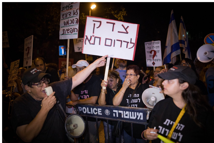
הפגנה של תושבי דרום תל אביב נגד המסתננים.

ישראל רחוקה מלהיות הדמוקרטיה היחידה ששולחת מהגרים לא-חוקיים בחזרה לארצותיהם. ארה"ב מגרשת בכל שנה 400,000 מהגרים לא-חוקיים. גרמניה שולחת מהגרים לא-חוקיים בחזרה לאפגניסטן, ואיטליה שולחת אותם בחזרה לסודן. ב-2017 גירשה גרמניה משטחה 80,000 מהגרים לא-חוקיים. החל מפברואר 2018, ממשלת גרמניה תשלם למהגרים לא-חוקיים 3,000 אירו לאיש כתמריץ לחזור לארצותיהם. מדיניות זו עולה בקנה אחד עם הנחיות 'המועצה האירופית', שהצהירה ב-19 באוקטובר 2017 שהיא מצדדת ב"תכניות ישוב-מחדש מרצון" של מהגרים לא-חוקיים.