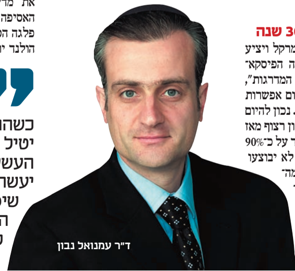
ד"ר עמנואל נבון

"אם הולנד יבוא לאנגלה מרקל ויציע לה לפתוח מחדש את האמנה הפיסקאלית, היא תזרוק אותו מכל המדרגות", הוא מעריך. "אני לא רואה שום אפשרות שהוא יישם את ההבטחות שלו. נכון להיום התקציב הצרפתי נמצא בגירעון רצוף מאז שנת 1974, החוב הצרפתי עומד על כ-90% מהתמ"ג, וההערכות הן שאם לא יבוצעו בו שינויים הוא יגיע ל-100% מהתמ"ג ב-2015. צרפת היא המדינה בעלת שיעור ההוצאות הממשלתיות מהתמ"ג הגבוה ביותר ב-OECD, יותר מבסקנדינביה. זה פשוט לא יכול להימשך. מישור צריך