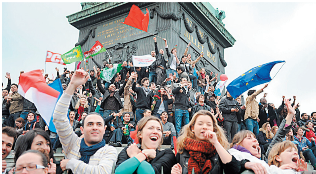
צהלת מחנה הולנד בכיכר הבסטיליה, ביום ראשון. משמאל: הנשיא הנבחר, אתמול בפחח ביתו