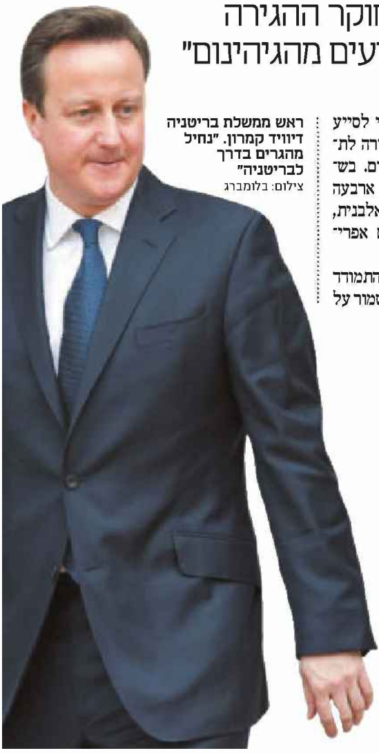
ראש ממשלת בריטניה דייוויד קמרון. "נחיל מהגרים בדרך לבריטניה"

העיר הצרפתית קאלה, שסמוכה לתעלה, הפכה למוקד החיכוך המרכזי בין פליטים ומהגרים מאפריקה והמזדה"ת לבין ממשלות בריטניה וצרפת. חוקר ההגירה ד"ר עמנואל נבון לכלכליסט: "אין סיכוי לעצור אנשים שמגיעים מהגיהינום"