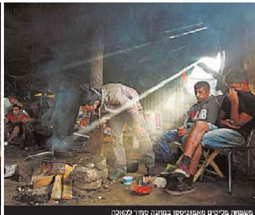
מהגרים אפריקאים רצים על המסילה שמובילה ליורוטאנל צילום: אי.בי.אי.אפי / מהגרים אפריקאים מנסים להיזדמנות לקפוץ על רכבת לבריטניה / מהגר מטפס על הגדר שנפרסה בכניסה ליורוטאנל / משפחת פליטים מאפניסטן במונה סמוך לקאלה