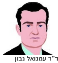
ד"ר עמנואל נבון

סקר חדש של החוג לפוליטיקה וממשל באוניברסיטת בן-גוריון מגלה כי 81% מן הישראלים תומכים בהצטרפותה של ישראל לאיחוד האירופי. ואכן, ישראלים נוטים לחשוב כי לו רק היינו משתייכים לאיחוד, מצבנו היה מעולה. אלא שמוקדם להתלהב. חברות מלאה באיחוד מביאה עימה גם חסרונות רבים.