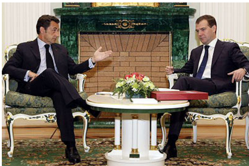
סרקוזי עם הנשיא מדבדב באוגוסט. לא הצליח לכופף את רוסיה

נבון סבור כי סרקוזי הפגין מנהיגות בטיפול בשני המשברים הבינלאומיים הגדולים של כהונתו - המלחמה בין רוסיה לגאורגיה והמשבר הכלכלי העולמי. "אין ספק שהסגנון ההיפראקטיבי שלו קיבל ביטוי בתקופה הזאת, אך למרות הפגנת המנהיגות, התוצאות שהושגו הן דלות, ולא רק באשמתו של נשיא צרפת", טען.