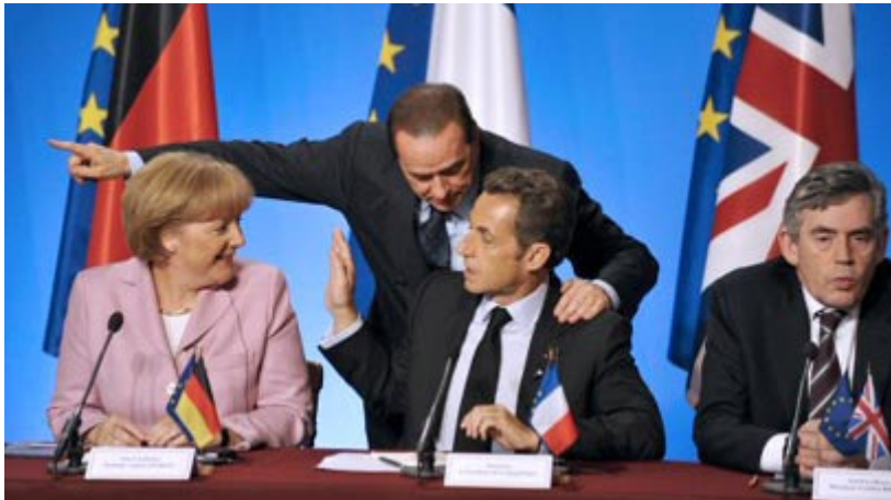
בראון, סרקוזי, ברלוסקוני ומרקל. דיבר כאחרון הסוציאליסטים

נבון גם מציין לטובה את התנהלותו של סרקוזי בכל הקשור לפגישה שערך עם מנהיגים הרוחניים של הטיבטים, הדלאי למה. בסוף השבוע האחרון, נפגש נשיא צרפת עם הדלאי למה באירוע רשמי בפולין, למרות אזהרות חוזרות ונשנות ואיומים מבייג'ינג. "סרקוזי נהג באומץ לב והבהיר לסין שלא ינקוט מדיניות של סטנדרטים כפולים רק בגלל עוצמתה", הסביר נבון. "הוא אותה שמדיניות סין בטיבט היא כיבוש, דיכוי וניסיון למחוק את התרבות הטיבטית – וכי אין בכונתו לבקר רק את הכיבוש הישראלי בשטחים ובמקביל להעניק לסינים צ'ק פתוח בטיבט. הוא עשה זאת למרות הכנס של הסינים – בשעה שמשד החוץ הבריטי נכנע בפני הסינים, וטען כי 'אנכרוניסטי' לא להכיר בריבונות סין בטיבט. למרות שלאחר המפגש פרסם סרקוזי הודעה שניסתה לפייס את סין – אי אפשר לזלזל בעצם המפגש".