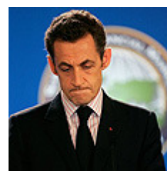
תוצאות דלות - לא רק באשמתו. סרקוזי

ואולם כדרכם של דברים, התוכניות הגדולות נשארו ברובן על הנייר, מאחר שהאירועים שהתרחשו באירופה ובעולם כולו טרפו את הקלפים וכפו שינויים בלתי מתוכננים. הנשיא התחייב לפתור את משבר האמנה האירופית שהתעורר לאחר שאירלנד דחתה את האמנה במשאל עם ביוני - והיום הודיעה ממשלתו כי צפו להתקיים משאל עם חוזר, אך הדבר תלוי באישור מנהיגי האיחוד; הוא רצה להעמיק את הקשרים עם רוסיה - ובמקום זאת קיבל את המלחמה בקווקז. המשבר הכלכלי העולמי נחת עליו - כמו על העולם כולו - בלי התרעה מוקדמת, ונראה שרק המיזם שפיתח, "האיחוד לים התיכון", הצליח להתקדם ולקרום עור וגידים מעבר לתכנונים על הנייר.