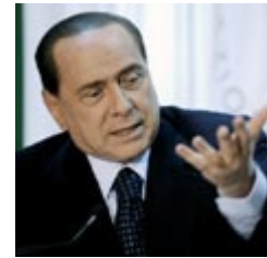
המארח. ברלוסקוני

"היום ברור שהמבנה של ה-G7 פלוס רוסיה הוא אנכרוניסטי", קובע הד"ר עמנואל נבון מהתוכנית לממשל ודיפלומטיה על שם אבא אבן באוניברסיטת תל אביב. "בשנות השבעים, כשהוקם המועדון הזה על ידי נשיא צרפת דאז ולרי ז'יסקאר ד'אסטן, זה היה ניסיון להקים מעין דירקטוריון של הכלכלות החזקות בעולם. אבל בעולם של ימינו, אין הגיון שבגוף שנועד לייצג את הכוחות הכלכליים המובילים בעולם חברות איטליה וקנדה – אך לא סין, הודו וברזיל", הוא מסביר. "מהסיבה הזאת, הפורום הכלכלי העולמי הנכון יותר לטיפול בבעיית המשבר הכלכלי הוא ה-G20, שכולל את 20 הכלכלות הגדולות בעולם, שנציגיו התכנסו בלונדון באפריל האחרון".