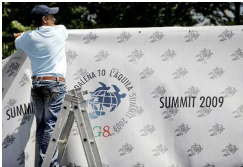
הכנות אחרונות לפסגה. רעשי המשנה מסכנים את המנהיגים?