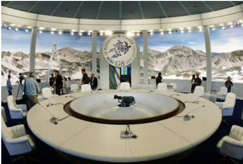
האולם שבו ייערכו הדיונים. תוכנית חילוץ למקרה חירום

בנאום שנשא קנצלרית גרמניה אנגלה מרקל בפרלמנט לפני ימים ספורים, ציינה מרקל כי פורום ה-G8 בעייתי, וטענה שיש להרחיבו. גם נשיא צרפת ניקולא סרקוזי ונשיא ברזיל לואיס אינאסיו לולה דה סילבה קראו ל"סדר עולמי דמוקרטי יותר", שיעניק לכלכלות עולות אפשרות להשמיע את קולן בזירה הבינלאומית, ובמאמר שפרסמו היום בעיתונים בברזיל וצרפת הציעו להקים "ברית לשינוי". הם לא פירטו מה תכלול הברית - ולא ציינו אם התוכנית זכתה לתמיכתם של מנהיגים נוספים.