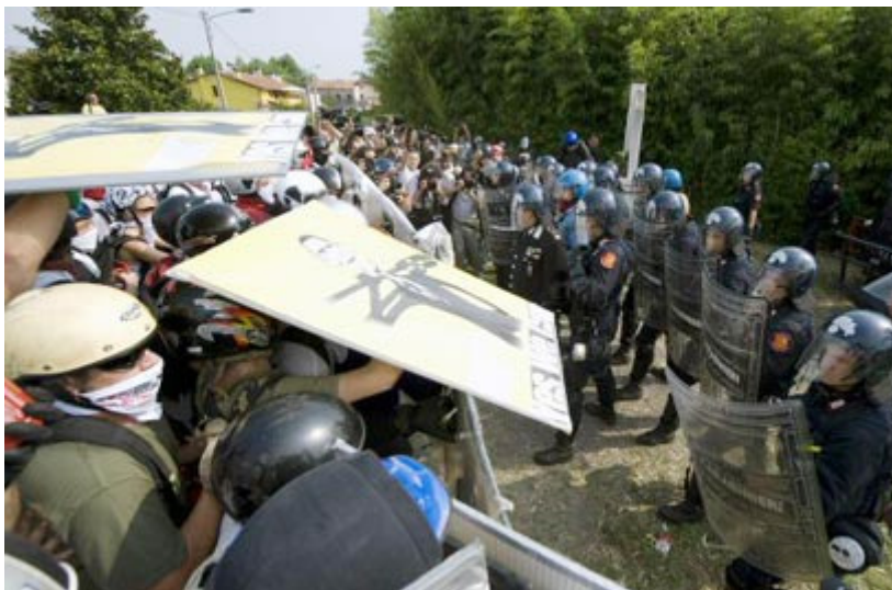
מפגינים מתעמתים עם שוטרים בוויצ'נזה, השבוע

מגזר אחד שלא צפוי להדיר רגליו מהפסגה למרות הפיכתה לשולית הם כמובן המפגינים נגד ה-G8, שנוהרים בהמוניהם לכל פסגה, בתקווה שיוכלו להשביתה ולכפות על המנהיגים את האג'נדות שאותן הם מקדמים – יהיו אלה חברתיות, כלכליות או סביבתיות.